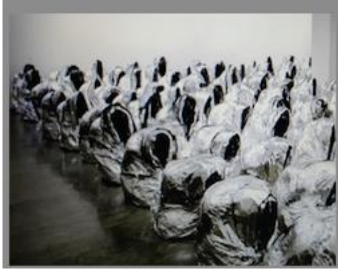
Ghosts, Détail, K. Attia, 2007.